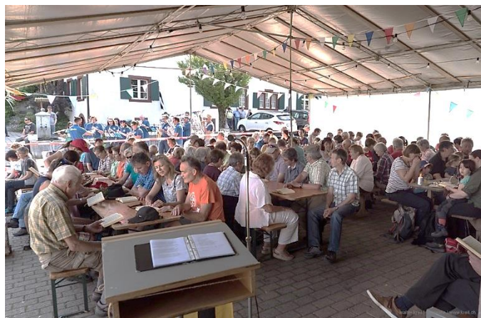
Banntagsgottesdienst am 25. Mai mit Musikverein Tenniken

Ein herzliches Danke an Behörden und Mitarbeitende beider Gemeinden für die schönen Kulissen!