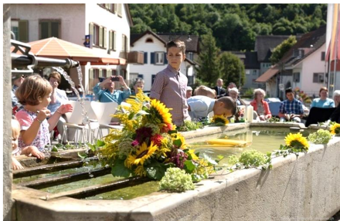
Zunzger Brunnentaufe mit Musikverein Zunzgen

Im Weiteren wollen wir dranbleiben, möglichst viele Freiwillige in unsere Anlässe, Gottesdienste, Angebote etc. einzubinden. Beispielsweise verdanken wir viele der Fotos in dieser Ausgabe Freiwilligen. Die Kirche wird umso lebendiger, je mehr verschiedene Leute helfen, ihre Kirche mitzugestalten. Möglicherweise kommen wir auf Sie zu ... oder vielleicht melden Sie sich einfach bei uns?