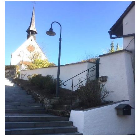
Aufgang Kirchentreppe nachher

in die Kirche, die Bepflanzung der Rabatte im Frühling soll dann das Ganze noch abrunden. Das Gelände zum Eingang zum Pfarrhaus soll als Unterstützung dazu beitragen, dass hoffentlich alle sicheren Fusses den Weg in unsere Räumlichkeiten finden. Es ist eine Freude, in einem so motivierten Team aus Mitarbeitenden und Kirchenpflegenden zu arbeiten. Manches geht halt nicht so schnell und