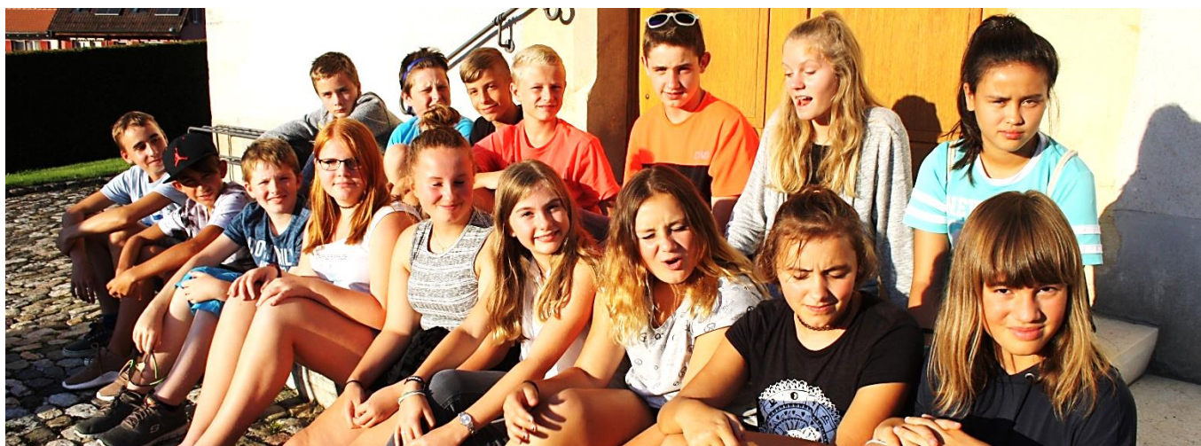
Die neue Impulsgruppe im Sommer 2017

In Genf startete der Freitagabend mit einem Taizégottesdienst in der Cathédrale St. Pierre, danach gings zum Reformationsdenkmal, wo wir einem Lichterspektakel zum Thema beiwohnen durften, ehe dann die Fahrt per Tram zur Unterkunft in Genf-Cointrin folgte – Mädchen und Jungs waren je in einer Turnhalle untergebracht. Nach einem einfachen aber ausreichenden Frühstück starteten am Samstagvormittag die Workshops und nach einem Mittagessen an verschiedenen Ständen gings nachmittags ins Expo-Gelände. Hier boten verschiedene Frei-, Landes- und Jugendkirchen sowie Muikbands ein buntes Nachmittagsprogramm an mit Pantomime, Predigt, Musik und vielem mehr.