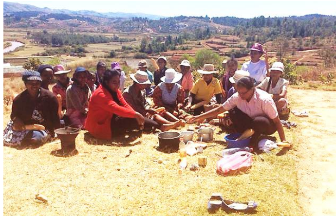
links: Steine für die Böden im Haus, die anschliessend mit Zement ausgegossen werden rechts: Teilnehmerinnen am Kochkurs

bessere Perspektive für ihr Leben zu ermöglichen. In Kursen erhalten die zwischen 15 und 30-Jährigen Inputs in Kochen, Nähen, Holzbearbeitung und nachhaltiger Landwirtschaft. Wer dank eines auswärts besuchten vierwöchigen Kurses ausbilden darf, verpflichtet sich, dem Projekt für mindestens zwei Jahre die Treue zu halten. Das ist nachhaltig!