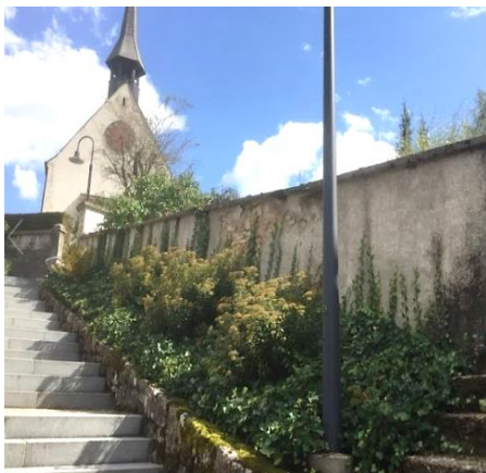
Aufgang Kirchentreppe vorher

Unser Bauverantwortlicher Marco Gisin war 2017 gleich mit vier wesentlichen Projekten beschäftigt: Der Kirchendachboden wurde isoliert, Kirchenfenster ausgebessert – beides verbesserte das Raumklima der Kirche spürbar. Die Renovation der Kirchenmauer entlang der Treppe verschafft nun einen freundlicheren Aufgang